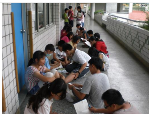
分享彼此挑選的段落，時間一到，就要換 partner