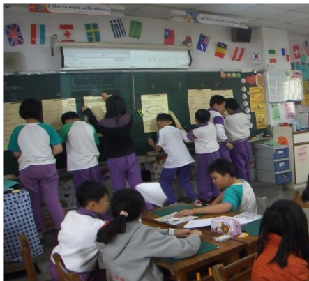
秀出小組討論後的答案