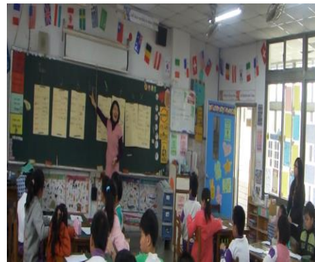
教師針對學生有疑惑的字回到讀本裡做解釋