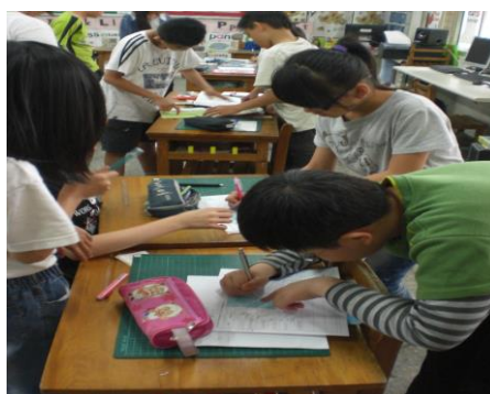
欣賞別人的畫，回想在書中的哪一頁