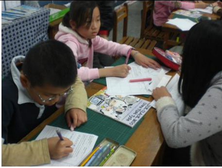
小組一起討論從文本裡可以提問的問題