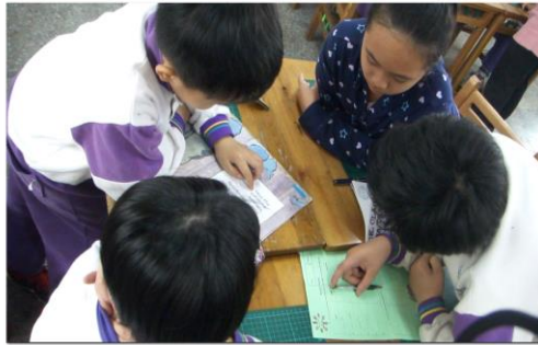
學生看了故事 part1 後，小組討論出生字，並寫出可能的意思。