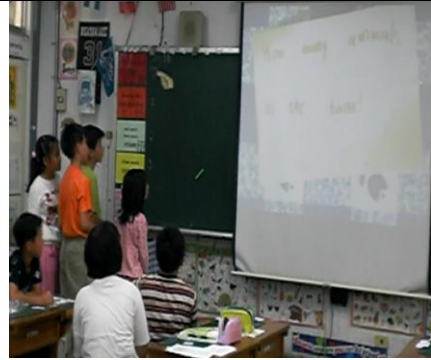
把我們想的問題拿來問大家